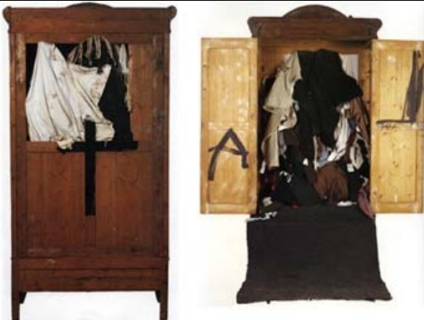
1973 - Armario