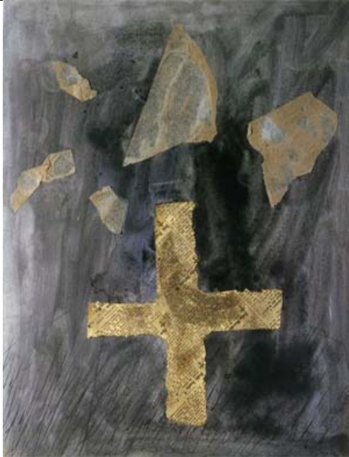
1946-1947 - Cruz de papel periódico