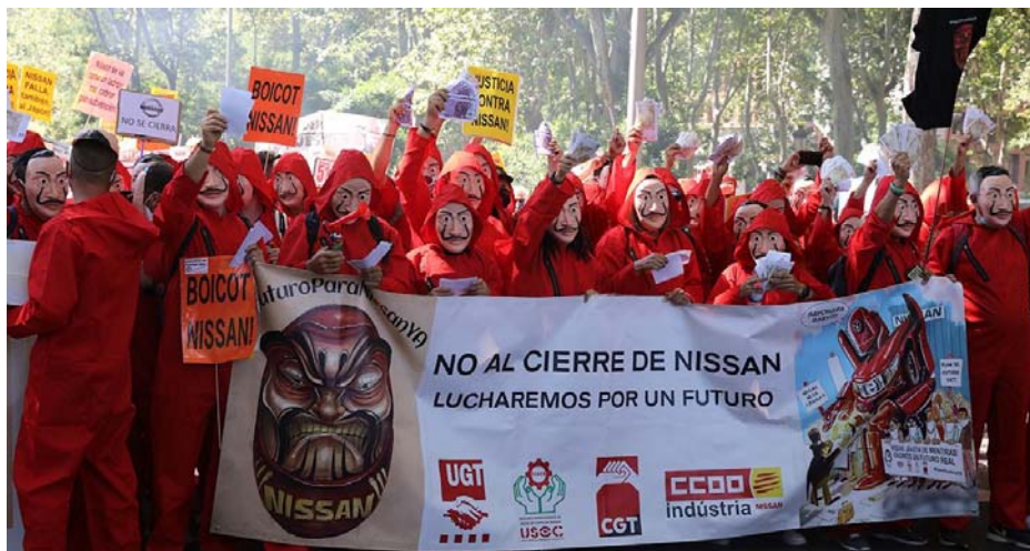
Barcelona, 15.07.2020 (cierre fábrica Nissan)